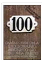
DICCIONARIO SECRETO VOL.2 (CELA) CELA, CAMILO J.