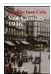
VISPERAS, FESTIVIDAD Y OCTAVA DE SAN CAMILO DEL AÑO 1936 EN CELA, CAMILO JOSE