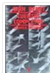
CUENTOS COMPLETOS 1 (BENET) BENET