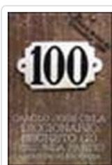
DICCIONARIO SECRETO VOL.2 (CELA) CELA, CAMILO J.