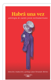
HABIA UNA VEZ VARIOS