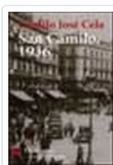
VISPERAS, FESTIVIDAD Y OCTAVA DE SAN CAMILO DEL AÑO 1936 EN CELA, CAMILO JOSE