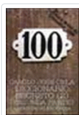
DICCIONARIO SECRETO VOL.2 (CELA) CELA, CAMILO J.