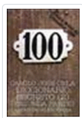
DICCIONARIO SECRETO VOL.2 (CELA) CELA, CAMILO J.