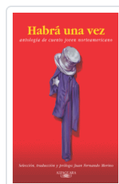
HABIA UNA VEZ VARIOS