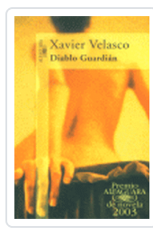
DIABLO GUARDIAN VELASCO, X.