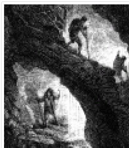
Viaje al centro de la Tierra