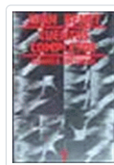
CUENTOS COMPLETOS 1 (BENET) BENET