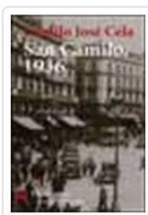
VISPERAS, FESTIVIDAD Y OCTAVA DE SAN CAMILO DEL AÑO 1936 EN CELA, CAMILO JOSE