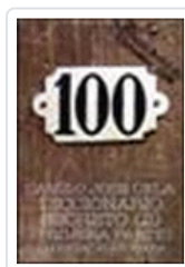
DICCIONARIO SECRETO 2. 1ª PARTE CELA