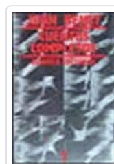
CUENTOS COMPLETOS 1 (BENET) BENET