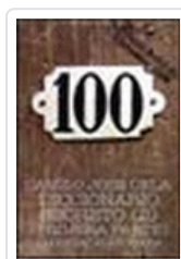
DICCIONARIO SECRETO 2. 1ª PARTE CELA