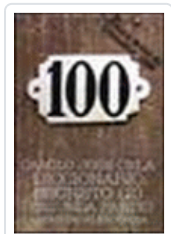
DICCIONARIO SECRETO VOL.2 (CELA) CELA, CAMILO J.