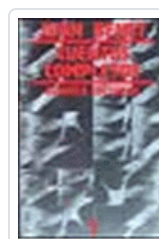
CUENTOS COMPLETOS 1 (BENET) BENET