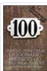
DICCIONARIO SECRETO VOL.2 (CELA) CELA, CAMILO J.