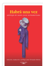
HABIA UNA VEZ VARIOS