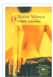
DIABLO GUARDIAN VELASCO, X.