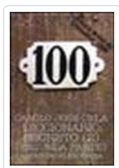
DICCIONARIO SECRETO VOL.2 (CELA) CELA, CAMILO J.