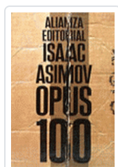
OPUS 100 ASIMOV