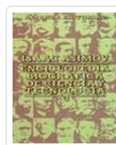
ENC. BIOGRAFICA CIENCIA TECNOLOGIA 3 ASIMOV