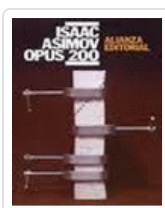
OPUS 200 ASIMOV