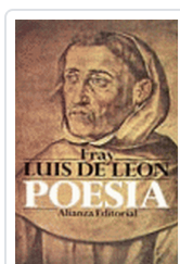
POESIA , FRAY LUIS DE LEON FRAY LUIS DE LEON