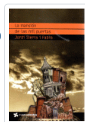
MANSION DE LAS MIL PUERTAS, LA (CUATROVIENTOS) SIERRA I FABRA, JORDI