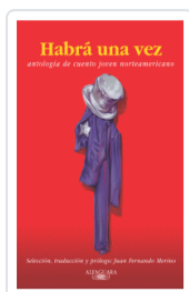
HABIA UNA VEZ VARIOS