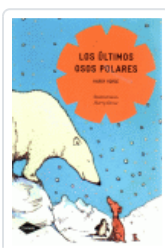
ULTIMOS OSOS POLARES, LOS (COMETA) HORSE, HARRY