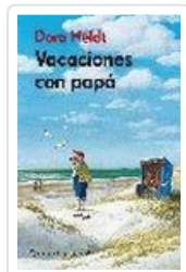
VACACIONES CON PAPA HELDT, DORA