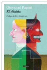
DIABLO, EL (BACKLIST) PAPINI, GIOVANNI