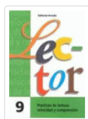
LECTOR Nº 9