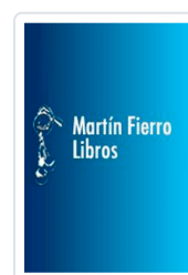
LECTOR Nº 12