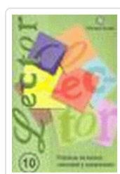
LECTOR Nº 10