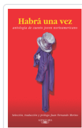
HABIA UNA VEZ VARIOS