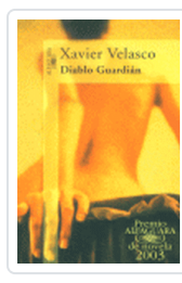
DIABLO GUARDIAN VELASCO, X.