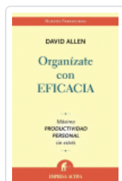
ORGANIZATE CON EFICACIA