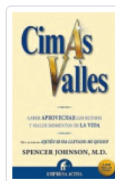
CIMAS Y VALLES. SABER APROVECHAR BUENOS Y MALOS MOMENTOS... SPENCER JOHNSON