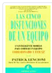
CINCO DISFUNCIONES DE UN EQUIPO, LAS