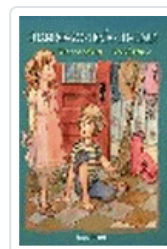
CUANDO YO TENIA TU EDAD