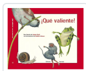
QUE VALIENTE! PAULI