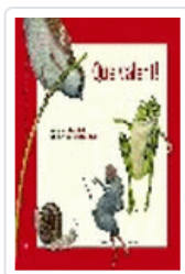
QUE VALENT! (CATALAN)