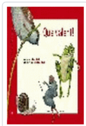
QUE VALENT! (CATALAN)