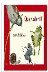
QUE VALENT! (CATALAN)