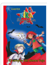
KIKA S. Y DANI VAMPIRO DIENTE FLOJO 3 KNISTER