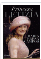
PRINCESA LETIZIA CAMPOS, MARIA TERESA