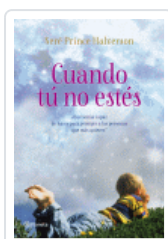
CUANDO TU NO ESTES PRINCE HALVERSON, SERE