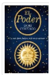
PODER, EL COUÑAGO, DORI