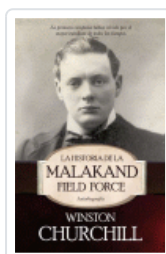
HISTORIA DE LA MALAKAND FIELD FORCE. AUTOBIOGRAFIA CHURCHILL, WINSTON