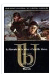
LLAMADA DE LA SELVA, LA COLMILLO BLANCO LONDON, JACK