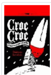
CROC-CROC LEVALLOIS, STEPHANE