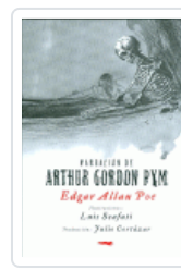
NARRACION DE ARTHUR G.PYM POE, EDGAR ALLAN