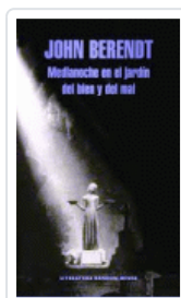
MEDIANOCHE EN EL JARDIN DEL BIEN Y DEL MAL BERENDT, JOHN