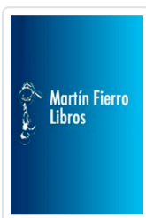
POR LA LIEBRE (OBRA PERIODISTICA 4) GARCIA MARQUEZ, GABRIEL