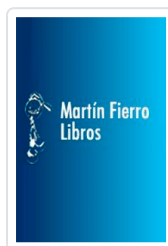
NOTICIA DE UN SECUESTRO GARCIA MARQUEZ, GABRIEL