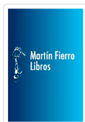
NOTICIA DE UN SECUESTRO GARCIA MARQUEZ, GABRIEL