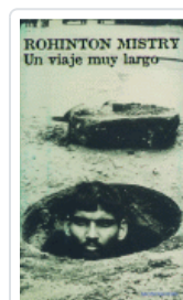
VIAJE MUY LARGO, UN MISTRY, ROHINTON