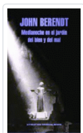
MEDIANOCHE EN EL JARDIN DEL BIEN Y DEL MAL BERENDT, JOHN