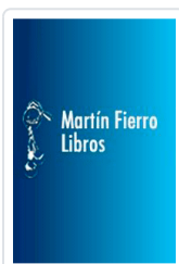
POR LA LIEBRE (OBRA PERIODISTICA 4) GARCIA MARQUEZ, GABRIEL