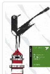
HABLAME DEL FANTASMA DEL FARO-ALADELTA2 BLANCO, TINA