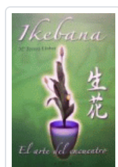
IKEBANA. ARTE JAPONÉS COMPOSICION FLORAL PALMER, ELISAB.