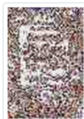
ESCUELA DE PINTURA TRUCOS Y EJERCICIOS THRAN, CHRISTIN