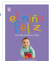
NIÑO FELIZ, EL BIDDULPH, S