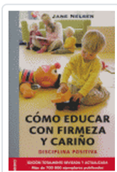
COMO EDUCAR CON FIRMEZA Y CARINO NELSEN, J. ET AL.