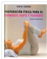
PREPARACION FISICA PARA EL EMBARAZO, PARTO Y POSPARTO CARRERA, J.M