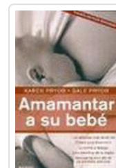
AMAMANTAR A SU BEBE PRYOR