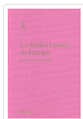
BIBLIA EROTICA DE EUROPA, LA LUST, ERIKA