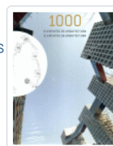
1000 ELEMENTOS DE ARQUITECTURA VV.AA.