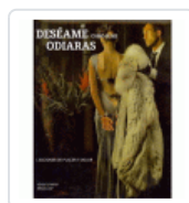
DESEAME COMO SI ME ODIARAS O'HARA, VENUS/LUST, ERIKA