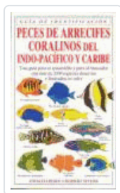
PECES DE ARRECIFES CORALINOS LIESKE, E. Y MYERS, R.