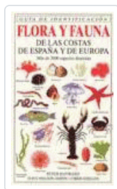
FLORA Y FAUNA COSTAS ESPAÑA Y EUROPA HAYWARD, ET. AL.