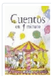
CUENTOS EN UN MINUTO