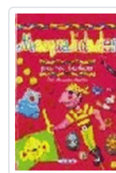
MANUALIDADES PARA TODOS MARTIN, MANUELA