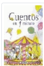
CUENTOS EN UN MINUTO