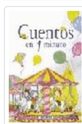
CUENTOS EN UN MINUTO