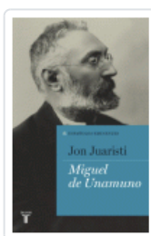
MIGUEL DE UNAMUNO. ESPAÑOLES EMINENTES JUARISTI, JON