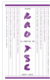
LIBRO DEL TAO, EL LIBRO DEL TAI BANERJEE, ABHIJIT VINAYAK/ DUFLO, ESTHER