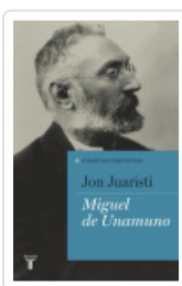
MIGUEL DE UNAMUNO. ESPAÑOLES EMINENTES JUARISTI, JON