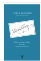
DISTINCION, LA. CRITERIO Y BASES SOCIALES DEL GUSTO BOURDIEU, PIERRE