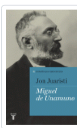
MIGUEL DE UNAMUNO. ESPAÑOLES EMINENTES JUARISTI, JON