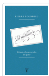
DISTINCION, LA CRITERIO Y BASES SOCIALES DEL GUSTO BOURDIEU, PIERRE