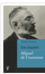
MIGUEL DE UNAMUNO. ESPAÑOLES EMINENTES JUARISTI, JON