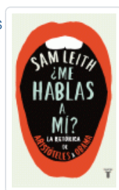
ME HABLAS A MÍ? RETORICA DE ARISTOTELES A OBAMA LEITH, SAM