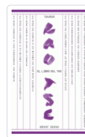
LIBRO DEL TAO, EL TAOÍSMO BANERJEE, ABHIJIT VINAYAK/ DUFLO, ESTHER