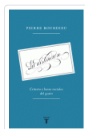
DISTINCION, LA CRITERIO Y BASES SOCIALES DEL GUSTO BOURDIEU, PIERRE