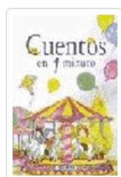
CUENTOS EN UN MINUTO