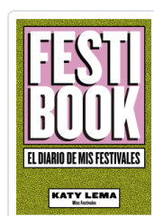
FESTIBOOK KATY LEMA (MISS FESTIVALES)