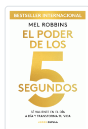
BESTSELLER INTERNACIONAL MEL ROBBINS EL PODER DE LOS 5 SEGUNDOS SE VALENTE EN EL DÍA A DÍA Y TRANSFORMA TU VIDA