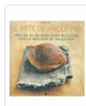
ARTE DE HACER PAN CON LA MAQUINA DE HACER PAN YTAK, CATHY