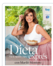
DIETA EXPRES CON MARILO MONTERO AA VV