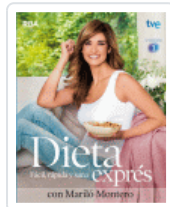
DIETA EXPRES CON MARILO MONTERO AA VV