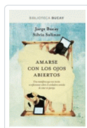
AMARSE CON LOS OJOS ABIERTOS BUCAY, JORGE