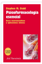
PSICOFARMACOLOGIA ESENCIAL 2º ED STAHL