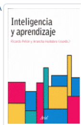
INTELIGENCIA Y APRENDIZAJE PELLON/HUIDOBRO (COORDS.)