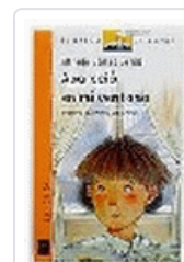
APARECIO EN MI VENTANA BVN 67 GOMEZ