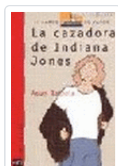
CAZADORA DE INDIANA JONES, LA BVR 53 BALZOLA